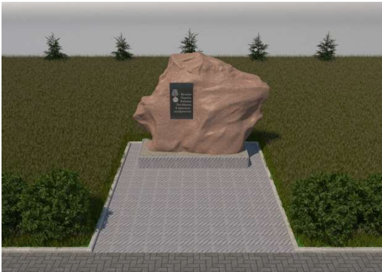
Вид с левого бока № 3